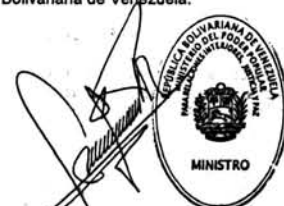
MIGUEL EDUARDO RODRÍGUEZ TORRES MINISTRO

Comuníquese y Publíquese, Por el Ejecutivo Nacional.