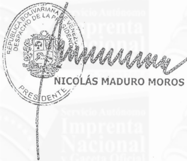
NICOLÁS MADURO MOROS PRESIDENTE

Refrendado El Vicepresidente Ejecutivo de la República y Primer Vicepresidente del Consejo de Ministros (L.S.)