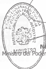
NÉSTOR LUIS REVEROL TORRES Ministro del Poder Popular para Relaciones Interiores, Justicia y Paz

Comuníquese y publíquese. Por el Ejecutivo Nacional,