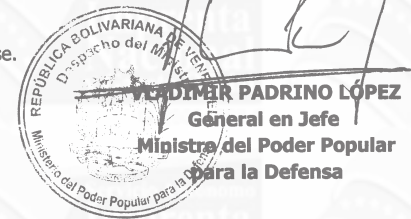
VLADIMIR PADRINO LÓPEZ General en Jefe Ministro del Poder Popular para la Defensa

Comuníquese y publíquese. Por el Ejecutivo Nacional,