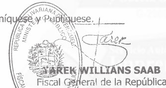
TAREK WILLIAMS SAAB Fiscal General de la República

REPÚBLICA BOLIVARIANA DE VENEZUELA MINISTERIO PÚBLICO