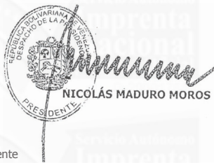
NICOLÁS MADURO MOROS

Refrendado El Vicepresidente Ejecutivo de la República y Primer Vicepresidente del Consejo de Ministros (L.S.)