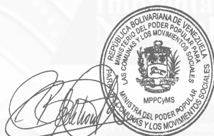
BLANCA ROSA ECKHOUT GÓMEZ

Ministra del Poder Popular para las Comunas y los Movimientos Sociales Decreto N° 3.604 de fecha 04 de septiembre de 2018, publicado en la Gaceta Oficial de la República Bolivariana de Venezuela N° 41.474, de fecha 04 de septiembre de 2018, reimpresso por fallas en los originales en la Gaceta Oficial de la República Bolivariana de Venezuela N° 41.479 de fecha 11 de septiembre de 2018