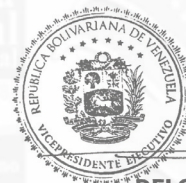
DELCY ELOÍNA RODRÍGUEZ GÓMEZ Vicepresidenta Ejecutiva

Refrendado La Ministra del Poder Popular para Relaciones Interiores, Justicia y Paz (L.S.)