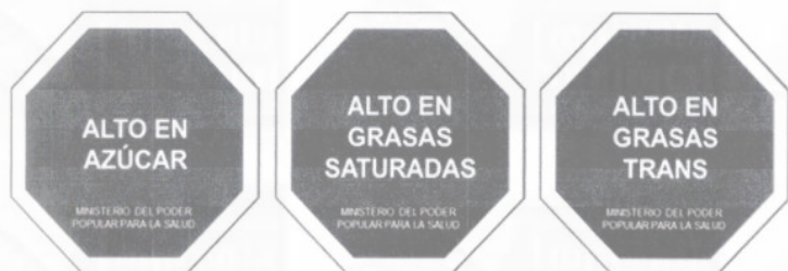
Diagrama N° 1. Figura octagonal a implementar en el etiquetado de alimentos manufacturados con alto contenido de azúcares añadidos, grasas saturadas y grasas trans.

Artículo 7. El rotulado establecido en el artículo 6 de la presente Resolución, así como el establecido en el artículo 7 de la Resolución N° 011 publicada en la Gaceta Oficial de la República Bolivariana de Venezuela N° 41.804 de fecha 21 de enero de 2020, deberá cumplir con las siguientes condiciones: