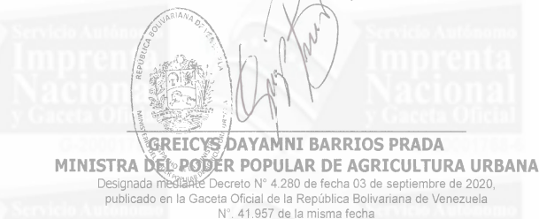
GREICYS DAYAMNI BARRIOS PRADA MINISTRA DEL PODER POPULAR DE AGRICULTURA URBANA Designada mediante Decreto N° 4.280 de fecha 03 de septiembre de 2020, publicado en la Gaceta Oficial de la República Bolivariana de Venezuela N° 41.957 de la misma fecha

Comuníquese y Publíquese. Por el Ejecutivo Nacional,