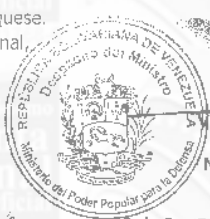
VLADIMIR PADRINO LÓPEZ General en Jefe Ministro del Poder Popular para la Defensa

Comuníquese y publíquese. Por el Ejecutivo Nacional,