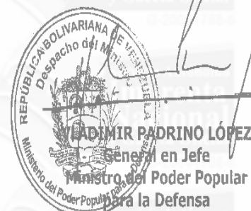
ADAMIR PADRINO LÓPEZ General en Jefe Ministro del Poder Popular para la Defensa