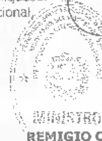
MINISTRO REMIGIO CEBALLOS ICHASO

Comuníquese y publíquese. Por el Ejecutivo Nacional,