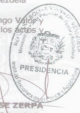
TOMÁS ENRIQUE GRIESE ZERPA Presidente Encargado del Instituto Socialista de la Pesca y Acuicultura (INSOPESCA)

Comuníquese y publíquese por el Ejecutivo Nacional