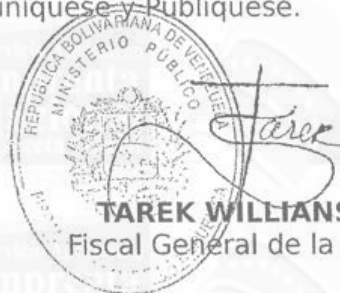
TAREK WILLIAMS SAAB Fiscal General de la República