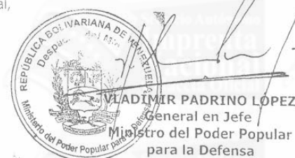
VLADÍMIR PADRINO LÓPEZ General en Jefe Ministro del Poder Popular para la Defensa

Comuníquese y publíquese. Por el Ejecutivo Nacional,