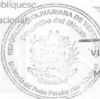
VLADÍMIR PADRINO LÓPEZ General en Jefe Ministro del Poder Popular para la Defensa

Comuníquese y publíquese Por el Ejecutivo Nacional,