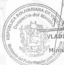
VLADIMIR PADRINO LÓPEZ General en Jefe Ministro del Poder Popular para la Defensa

Comuníquese y publíquese. Por el Ejecutivo Nacional,