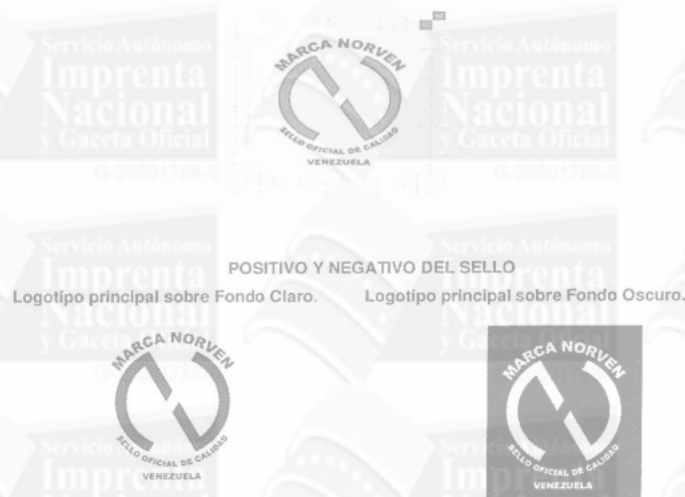
POSITIVO Y NEGATIVO DEL SELLO Logotipo principal sobre Fondo Claro. Logotipo principal sobre Fondo Oscuro.

Artículo 26. El logotipo de la Marca NORVEN Sello Oficial de Calidad Venezuela , que incluirá el diseño de la marca para cada producto, proceso o servicio es el que se muestra a continuación: