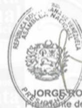
JORGE RODRÍGUEZ GÓMEZ Presidente de la Asamblea Nacional

Dado, firmado y sellado en el Palacio Federal Legislativo, sede de la Asamblea Nacional, en Caracas, a los dos días del mes de abril de dos mil veinticuatro. Años 213° de la Independencia, 165° de la Federación y 25° de la Revolución Bolivariana.