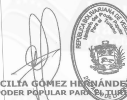
LETICIA CECILIA GÓMEZ HERNÁNDEZ MINISTRA DEL PODER POPULAR PARA EL TURISMO

Comuníquese y Publíquese, Por el Ejecutivo Nacional.