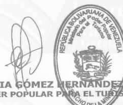
LETICIA CECILIA GÓMEZ HERNÁNDEZ MINISTRA DEL PODER POPULAR PARA EL TURISMO

Comuníquese y Publíquese, Por el Ejecutivo Nacional.