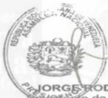
JORGE RODRÍGUEZ GÓMEZ Presidente de la Asamblea Nacional

Dado, firmado y sellado en el Palacio Federal Legislativo, sede de la Asamblea Nacional, en Caracas a los dieciocho días del mes de febrero de dos mil veinticinco. Años 214° de la Independencia, 165° de la Federación y 26° de la Revolución Bolivariana.