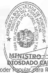
MINISTRO DIOSDADO CABELLO RONDÓN

Comuníquese y publíquese. Por el Ejecutivo Nacional,