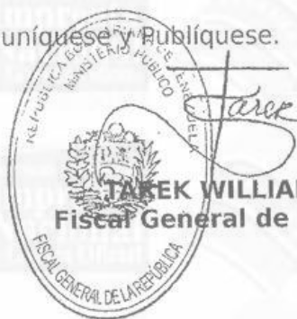
TAREK WILLIANS SAAB Fiscal General de la República.