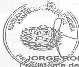
JORGE RODRÍGUEZ GÓMEZ Presidente de la Asamblea Nacional

Dado, firmado y sellado en el Palacio Federal Legislativo, sede de la Asamblea Nacional, en Caracas a los diez días del mes de abril de dos mil veinticinco. Años 214° de la Independencia, 166° de la Federación y 26° de la Revolución Bolivariana.