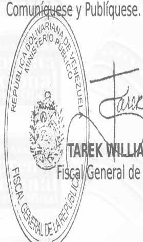
TAREK WILLIANS SAAB Fiscal General de la República